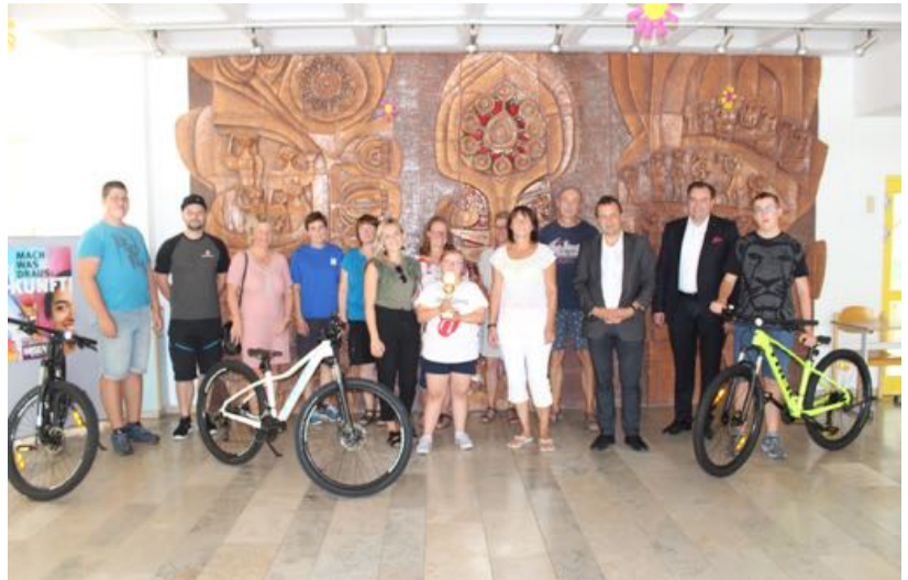
Spendenübergabe in der Aula der Cabrini-Schule